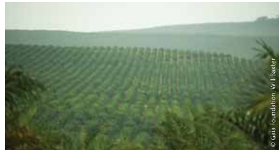
Palmölplantagen im Distrikt Kalangala, Victoriasee, Uganda.

Die Untersuchung stützt sich auf mehrere Studien und Presseberichte sowie Vor-Ort-Recherche. Es mangelt allerdings an umfassender öffentlicher Information über Landgeschäfte; Landbesitz ist in den meisten Teilen Afrikas schwer zu ermitteln. Die Situation vollständig darzustellen ist dementsprechend fast unmöglich. Dazu kommt, dass die politische Lage in einigen afrikanischen Staaten es Einzelnen sowie der Öffentlichkeit erschwert, an offizielle Informationen zu gelangen oder auch nur offen zu reden. Diese Untersuchung stellt daher lediglich eine Momentaufnahme auf der Grundlage frei verfügbarer Information dar. Verbesserte Transparenz und weitere Nachforschung sind dringend notwendig.