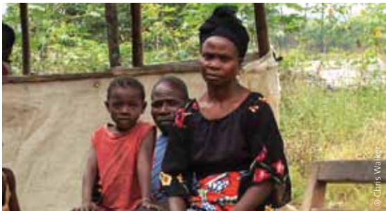
Dorfbewohner aus der Nähe von M'Boundi, Kongo.

In Tansania wurden tausende Reis- und Maisbauern 2009 von ihrem Land vertrieben oder mit Vertreibung bedroht, um für Zuckerrohrplantagen in verschiedenen Teilen des Landes Platz zu schaffen. Über 1000 Reisbauern mussten 2009 ihr Land in den Usangu-Ebenen verlassen, was zu Auseinandersetzungen im ganzen Land führte. Eine vergleichbare Zahl musste mit der Vertreibung aus dem Wami-Becken zugunsten einer geplanten Plantage rechnen. 58 Europäische Unternehmen mit Unterstützung der EU-Energieinitiative sowie Gelder zur Entwicklungshilfe aus England und den USA stecken hinter einer Reihe derartiger Entwicklungen. 59 Jatropa- und Sonnenblumenplantagen wurden auch bereits vorgeschlagen. Bauernproteste haben dazu geführt, dass die Regierung in Tansania ihre Einstellung zu Agrotreibstoffen überdenkt. 60