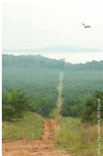
BIDCO Palmölplantagen im Distrikt Kalangala, Victoriasee, Uganda.

Der afrikanische Kontinent wird vom Rest der Welt zunehmend als Quelle für landwirtschaftliche Nutzflächen und Rohstoffe gesehen. Regierungen und private Unternehmen sichern sich Flächen auf dem ganzen Kontinent, um den wachsenden Bedarf an Nahrung und Treibstoffen für Übersee zu decken. Agrotreibstoffe – der großangelegte Anbau von Saaten, die der Produktion von Flüssigbrennstoffen dienen – werden dabei von manchen als silberne Kugel für Afrika bezeichnet.