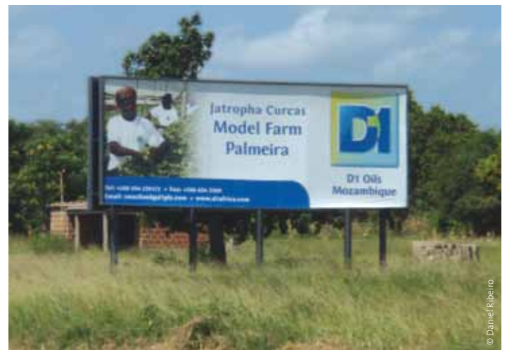
Beispiel für ein Jatropha -Projekt von D1 Oils in Maputo – Mozambique.

D1 Oils' Gemeinschaftsunternehmen mit dem Ölriesen BP fand 2009 mit dem Rückzug von BP ebenfalls ein Ende. 121