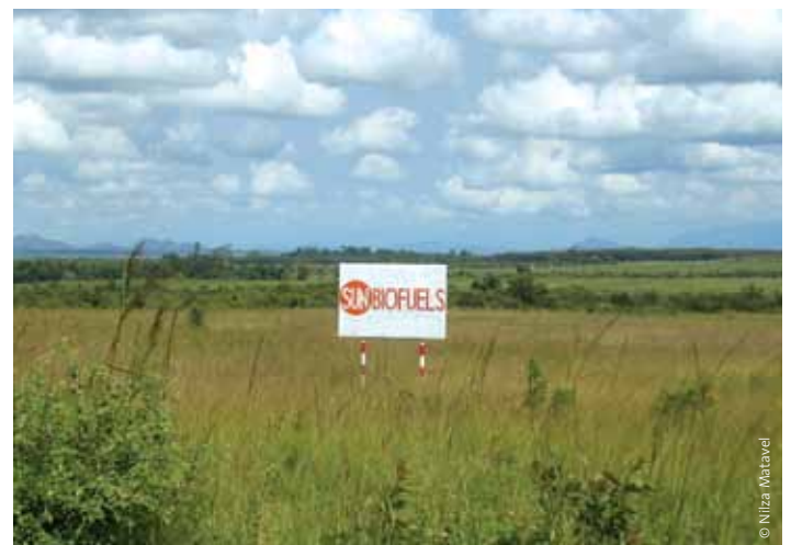
Beispiel für ein Jatropha-Projekt von Sun Biofuels in Manica – Mozambique.