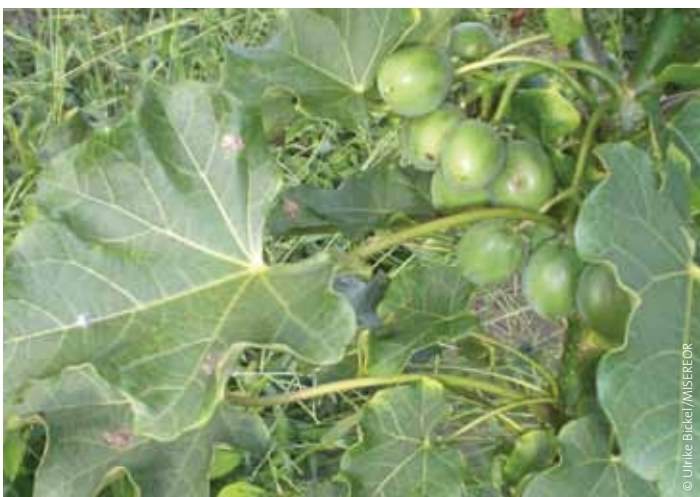
Purgiemussbaum ( Jatropha curcas ).

Sojabohnen, Süßkartoffel, Erdnüsse, Getreide und Kopra werden in den afrikanischen Staaten ebenfalls zur Kraftstoffproduktion verwendet.