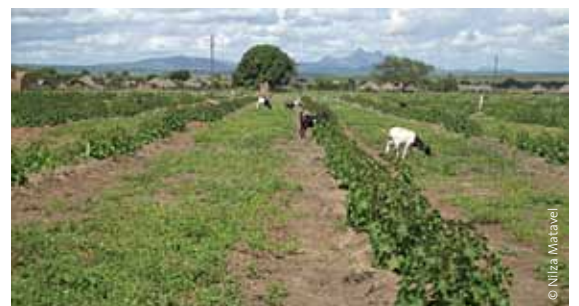
Sun Biofuels – Manica, Mozambique.