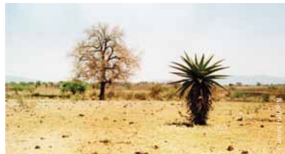
Wüstenbildung: tiefgelegenes ehemaliges Ackerland, Swasiland.

Pläne zur Anlage von großen Zuckerrohrplantagen in Nigerias Bundesstaat Gombe haben zu Bedenken über den Gebrauch von Pestiziden und die Folgen für angrenzendes Ackerland geführt. 99