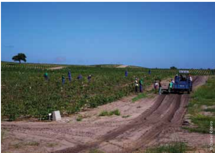
Arbeiter von Energem, Dzewe Gemeinde, Distrikt Bilene in Mozambique

In manchen Fällen wird berichtet, dass ausländische Unternehmen die örtlichen Gesetze zum Schutz der Rechte der Arbeiter missbrauchen. Sun Biofuels, auch in Mozambique, beschäftigt 430 Arbeiter auf Jatropha-Plantagen – Berichten zufolge mit einer 45-Stunden-Woche und längeren Arbeitstagen als gesetzlich erlaubt. 86