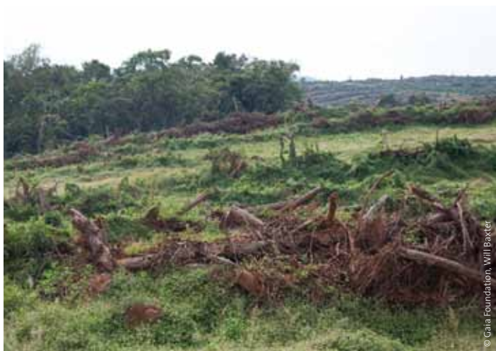
Für Palmölplantagen gerodetes Land in Kalangala, Victoriasee, Uganda.

Eine erschöpfende Liste von exemplarischen Landnahmen zur Agrotreibstoffproduktion findet sich im Anhang.