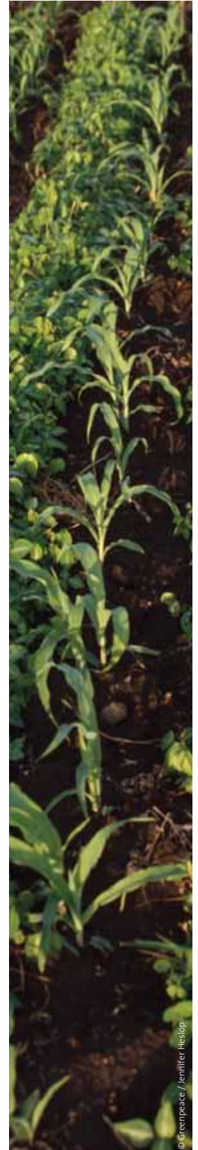
Junge Mais- und Silverleaf Eichenpflanzen, Suba Distrikt, Kenia.

Schutz von Farmarbeitern: Farmarbeiter sollten angemessenen Schutz genießen; ihre grundlegenden Menschen- und Arbeitsrechte sollten gesetzlich verankert und praktisch geltend gemacht werden, und zwar gemäß den Maßgaben der Internationalen Arbeitsorganisation ILO. Den Schutz der Arbeiter zu erhöhen würde dazu beitragen, ihren Zugang und den ihrer Familien zu ausreichender und angemessener Nahrungsversorgung zu gewährleisten.