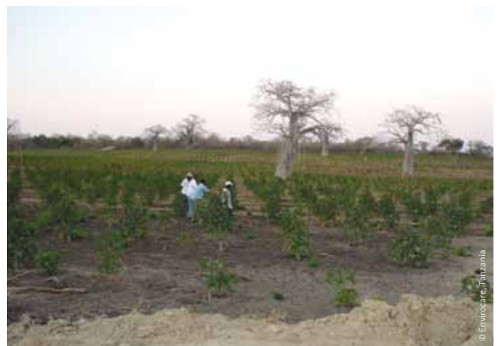
Jatropha-Anbaugesamt von Bioshape in Kilwa, Tansania.

Noch wesentlich wichtiger ist die Verfügbarkeit von fruchtbarem Land mit vorhandener Wasserversorgung. Zwar gibt es Behauptungen, dass Agrotreibstoffpflanzen wie Jatropha und Süßsorghum auch auf Grenzertragsböden gut wachsen, allerdings betreffen etliche „Landnahmen“ für Agrotreibstoffe ehemaliges Ackerland.