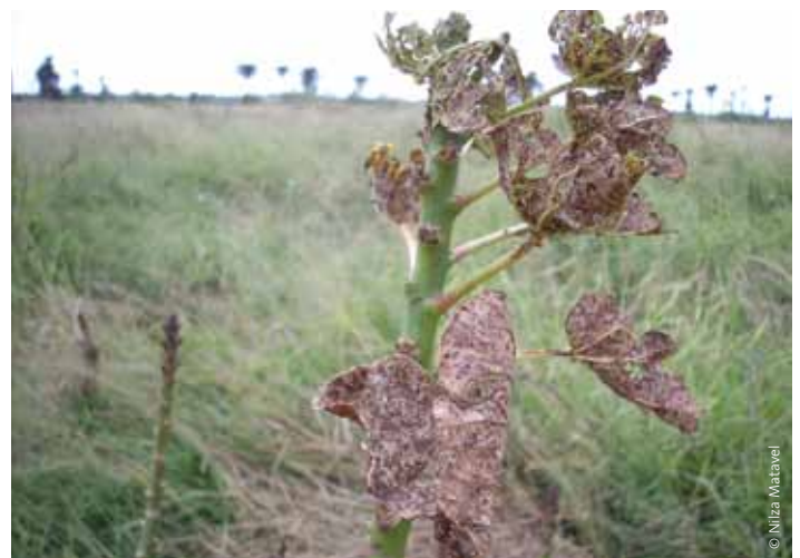
Schädlingsbefallene Jatropha, Moamba-Distrikt in Mozambique.

Jatropha-Bauern der União Nacional de Camponeses (UNAC) in Mozambique berichten von langsamen Wachstumsraten, niedrigen Erträgen, und Problemen mit Schädlingen. 89