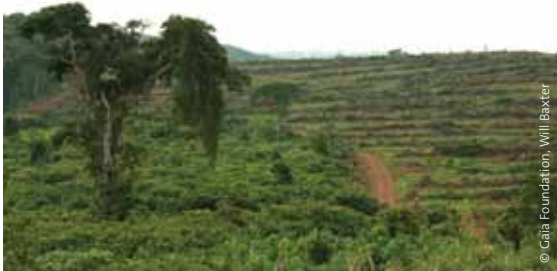
BIDCO Palmölplantagen im Distrikt Kalangala, Victoriasee, Uganda.

Genau wie afrikanische Staaten mit ansehen mussten, dass fossile Brennstoffe und andere natürliche Rohstoffe zum Nutzen anderer Länder ausgebeutet wurden, besteht das Risiko, dass Agrotreibstoffe zu minimalem Gewinn der lokalen Gemeinden und Nationalökonomien ins Ausland exportiert werden. Den Gastgeberländern bleiben ausgelaugte Böden, versiegte Flüsse und zerstörte Wälder.