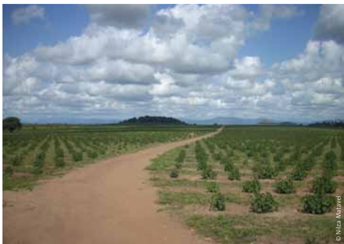
Jatropha-Plantage von Sun Biofuels.

Sorge um die Energieversorgung scheint ebenso ein wesentlicher Faktor für die Nachfrage nach Biokraftstoffpflanzen zu sein – die EU fordert, dass bis 2010 10% der Transportkraftstoffe aus „erneuerbaren“ Quellen stammen. Das EU-Planziel hat Nachfrage erzeugt, die, den Landpreisen und der Landknappheit innerhalb der EU entsprechend, wohl unvermeidlich durch Importe gedeckt werden wird.