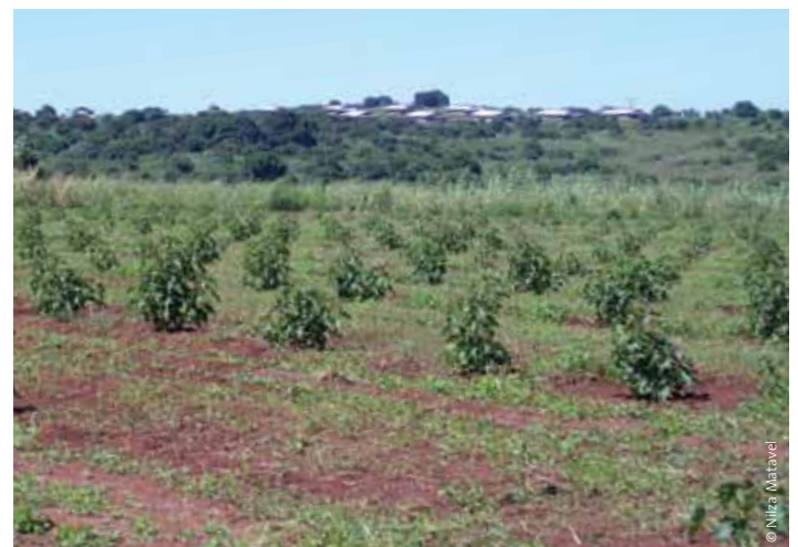
Plantage von MoçamGalp in Mozambique.

Der Weltklimarat hat die fortschreitende Austrocknung Afrikas durch einen Rückgang von Regenfällen als Folge des Klimawandels vorhergesagt. Die Flächen Afrikas, die als „trocken“ eingestuft werden, könnten um bis zu 90 Millionen Hektar anwachsen. Der Wassermangel wird landwirtschaftliche Erträge beeinflussen und die Viehhaltung in manchen Gebieten unmöglich machen. 109