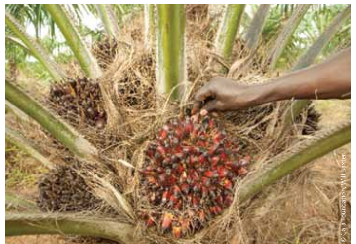
Frucht der Ölpalme.