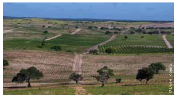
Plantage von Energern in der Gemeinde Dezeve im Bilene-Distrikt in Mozambique.

Senegal hat ein staatliches Biokraftstoffprogramm eingeführt, Nigeria sich zum Ziel gesetzt, bis 2020 10% heimisch produzierte Biokraftstoffe als Transportkraftstoffe zu verwenden. Andere Länder wie Mozambique und Ghana scheinen Agrotreibstoffe auch enthusiastisch aufgenommen zu haben. Mozambique ist nur einer vieler Staaten, die in Agrotreibstoffpflanzen wie Jatropha die Möglichkeit sehen, die Abhängigkeit von Treibstoffimporten zu senken. 35