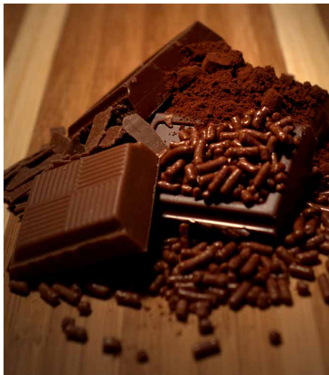
Man sieht es der Schokolade nicht an, aber der Kakao dafür wird häufig mit hochgefährlichen Pestiziden besprüht.

Vor dem Hintergrund der strukturellen Armut, in der die meisten Kakaobäuer*innen leben, sind sie besonders anfällig für die schädlichen Auswirkungen hochgefährlicher Pestizide. Ihre Einkommen sind häufig so gering, dass sie sich die notwendige Schutzausrüstung wie Handschuhe, Brillen oder Stiefel nicht leisten können. Die im Kakaoanbau eingesetzten Wirkstoffe können sowohl akute Vergiftungen als auch chronische gesundheitliche Folgen verursachen. Ohne ausreichende Schutzausrüstung sind die Kakaobäuer*innen diesen Risiken direkt ausgesetzt. Diese Wirkstoffe sind darüber hinaus auch für Menschen, die in der Umgebung von Kakaoanlagen leben, gefährlich.