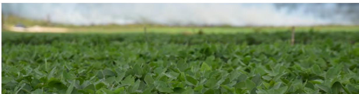
Sojaanbau in Brasilien mit Brandrodung im Hintergrund.

Für Betriebe, die Rinderprodukte auf den Markt bringen, gilt: Marktteilnehmer (oder Händler, die keine KMU sind) müssen alle Betriebe angeben, die mit der Aufzucht und Fütterung der Rinder in Verbindung stehen, einschließlich deren Geburtsorten, Weideflächen und Schlachthöfen.